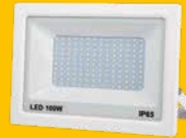
PROJECTEUR LED EXTRA PLAT 100 W BLANC

Voltage 230V/50HZ lumière blanche froide (6000K).