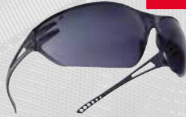
LUNETTE BOLLÉ Fumé.