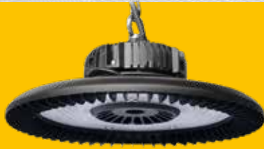
CLOCHE INDUSTRIELLE LED 100W

14500LM. Projecteur d'atelier high bay avec transformateur Meanwell. Qualité professionnelle, angle d'éclairage 90°.