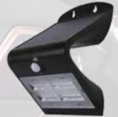
APPLIQUE SOLAIRE LED NOIRE 400LM 3 modes. Capteur de mouvements. Énergie solaire : installation facile, 3.2W.