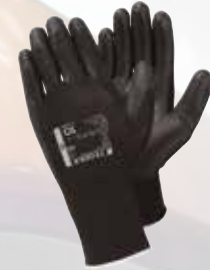
GANT TEGARA Paume imperméable à l'eau et à l'huile.