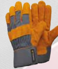
GANT TEGARA Gant en cuir, semi doublé. Index renforcé, doigts et pouces renforcés.