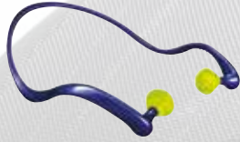
ARCEAU MOLDEX Protection anti bruit.